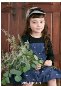
petit main 形象圖

「9090」以「文化復興」為概念，受到 90 年代至 00 年代青年文化啟發，推出古著混搭設計的街頭品牌。自 2018 年成立以來，品牌主要透過社群媒體進行運營，並於 2023 年在原宿設立了旗艦店，同時擴展至大阪和名古屋。過去品牌曾與 AAPE、umbro、寶可夢等多個合作對象聯手推出聯名系列。