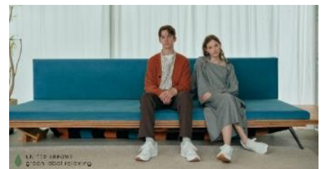
green label relaxing 形象圖

「green label relaxing」1998 年創立於東京，品牌理念「Be Happy ~ 時尚讓人每天都心情愉悅 ~」希望作為契合各種不同生活型態並兼具時尚的店鋪。透過對品質的堅持，捕捉每一季的流行趨勢，以貼近顧客日常的風格，來引領著日本的時尚，是長期受到支持及喜愛的品牌；「Nano