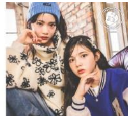
repipi armario 形象圖

在台灣擁有高人氣的「BEAMS」；「URBAN RESEARCH」；「relume