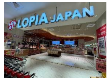
LOPIA JAPAN 形象圖

「LOPIA JAPAN」的經營理念以『食生活♡樂比亞』為座右銘，用食生活為主，LOVE LOVE 樂比亞，讓顧客喜愛來樂比亞，以打造低價格之烏托邦而誕生的公司。所謂的烏托邦，是讓人感到快樂、感動、隨時都想前往之理想國度；「akachan honpo」阿卡將