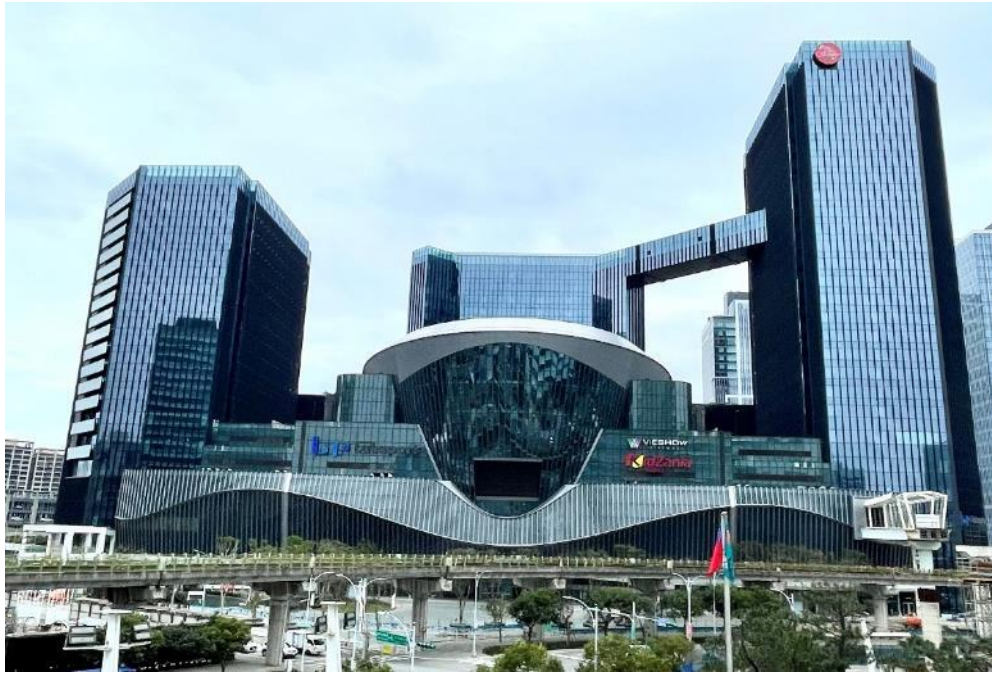
本開發案建築外觀

未來，本案將與周邊建物，包含南港展覽館、捷運機廠、中國信託金融園區、鄰近的開發案等以連通空橋串聯，提升各個建物間的使用者能夠更加便利的互相往返其中。三井不動產集團期望藉由進駐本案後能夠帶動南港周邊更大的經濟效益與繁榮發展，同時創造更多的就業機會。