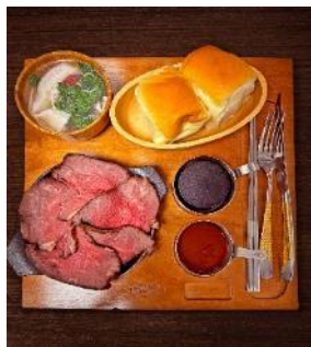
SAPPORO BONE 形象圖

「SAPPORO BONE」於 2015 年在日本北海道設立，主營肉類排餐品牌的 SAPPORO BONE 將海外首店獻給 LaLaport 南港，重現經典日式烤生牛肉與各類排餐餐點。