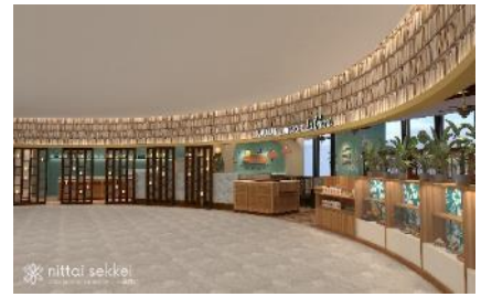
La Ohana 形象圖

「La Ohana」將廣受日本人喜愛的夏威夷風格引進臺灣，首號店進駐 LaLaport 南港，提供五感充盈的沉浸式餐飲體驗。La 在夏威夷語是太陽、Ohana 是家人的意思，品牌概念是仿造夏威夷度假飯店。從門口設置的香氛機、島嶼風情的背景音樂、度假氛圍的木造及藤編家具，身著夏威夷衫的熱情服務人員、日式和美式的料理選項，到選物紀念品區，在盼望顧客在店內用餐期間就像在度假般放鬆愉快。