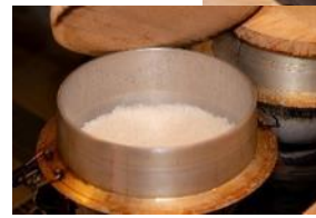
三之星ミツボシ 形象圖

「三之星ミツボシ」用袴鍋煮出的美味米飯和來自烤肉店的牛肉搭配特製醬汁，完成一道美味的米飯和肉菜。